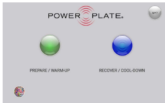
Könnyen érthető kezdőképnyő